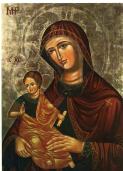
Odigitria di Bisceglie