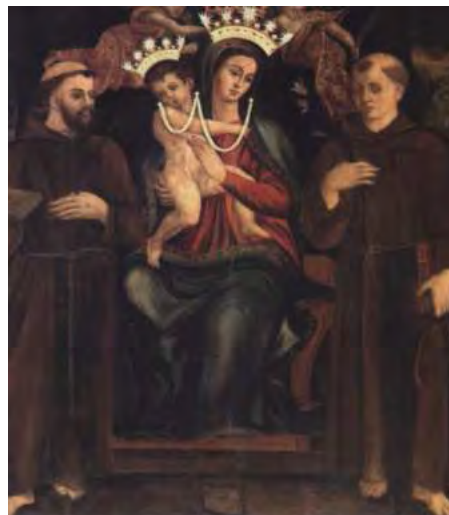
Madonna della Consolazione – Reggio Calabria

È interessante, inoltre, sottolineare la diversa origine dei santi presenti nelle due icone: sono orientali i santi Giorgio e Teodoro, mentre Francesco d'Assisi e Antonio da Padova appartengono all'ordine monastico occidentale dei francescani, del quale fanno parte anche i cappuccini di Reggio Calabria, primo nucleo francescano riformato del meridione d'Italia 8 , per i quali l'effigie reggina venne realizzata 9 .