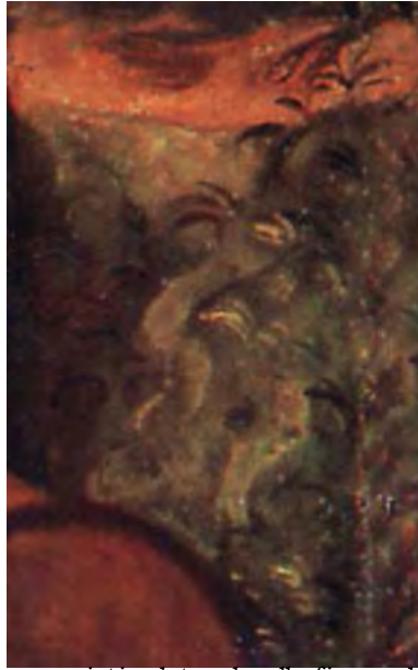
Lo scorcio paesaggistico laterale alla figura di Sant'Antonio