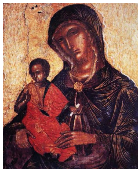
Odigitria di Belcastro

Il Capriolo orna il manto con un bordo pregevole di pietre preziose, incastonate in una doratura continua che impreziosisce notevolmente il dipinto e rivela una cura non indifferente per i particolari. Le pietre rosse e blu, richiamano i colori della veste e del manto e si alternano a coppie regolari, tranne quando, formano, in alcuni punti strategici, piccoli