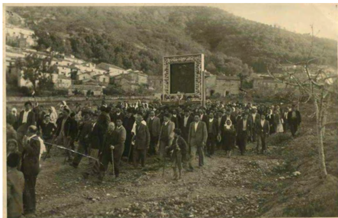
L'icona della Madonna della Consolazione nel 1952 a Fossato

L'assetto figurativo è già stato esplicitato e comparato a modelli ben più antichi. Ci si dedicherà, adesso, alla lettura analitica operata anche attraverso la sua definizione stilistica, per mezzo della comparazione con opere coeve o precedenti prodotte in Italia, contemplando quel rimando all'Urbinate, già solleticato da Tommaso Vitriolo. 58