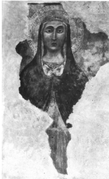
Alto monte, Madonna della Consolazione

Tutto ciò fa comprendere come i legami tra i francescani e gli angioini fossero saldi 48 e, inoltre, lega il culto rivolto alla Vergine della Consolazione all'ordine dei Mendicanti. Più indietro nel tempo, sul territorio prossimo alla città di Parigi, nel periodo di regno di Luigi IX, sorse, nella foresta di Sénart 49 , per volontà del pio sovrano un eremo noto come l'Ermitage de la forêt de Sénart . Antichi testi così lo descrivono: