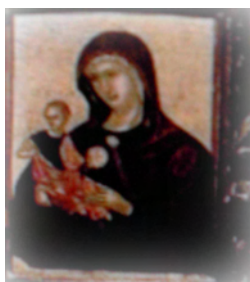
Nicolaos Tzafuris: La Madonna della Consolazione della collezione Kanelopoulos ad Atene

Tutte quante le figure sono pressoché identiche nell'impostazione e appaiono molto curate e raffinate nei particolari. Il modello, in voga fino al XVII secolo, in seguito perse quella notorietà certamente connessa alla tradizione pittorica che con Tzafuris ebbe inizio e che seppe coniugare innovativi stilemi occidentali 20 alla consolidata pratica pittorica greco-ortodossa.