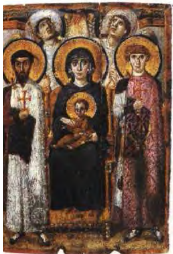
Vergine tra i santi Giorgio e Teodoro – Sinai